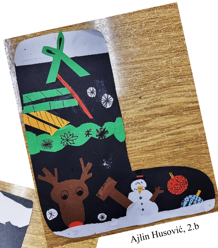
Ajlin Husović, 2.b