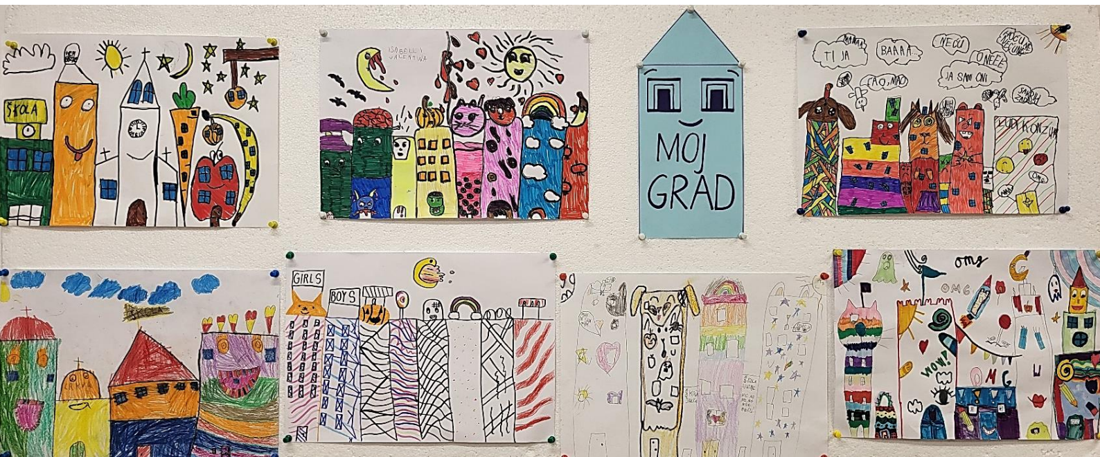
Svjetski dan gradova (31. listopada 2024.) – Moj grad po uzoru na umjetnika Jamesa Rizzia