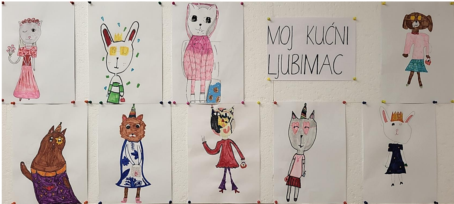
Svjetski dan zaštite životinja (4. listopada 2024.) – Moj kućni ljubimac po uzoru na umjetnicu Indi Maverick