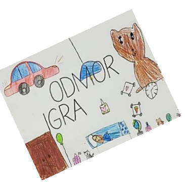
Međunarodni dan dječjih prava (20. studenog 2024.)