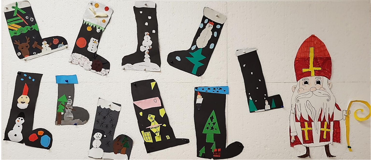
Sveti Nikola (6. prosinca 2024.) – Čizmice za Svetog Nikolu