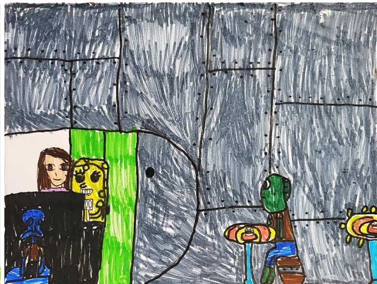
Isabell Frančišković, 2.b